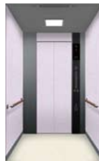
エレベーターかご室