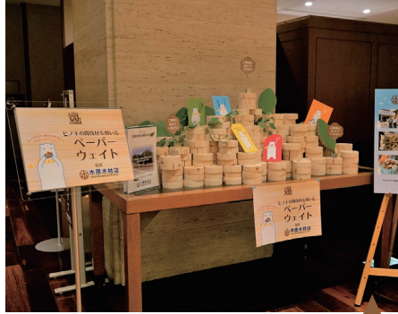
毎年恒例!ペーパーウエイト 提供:木原木材様より