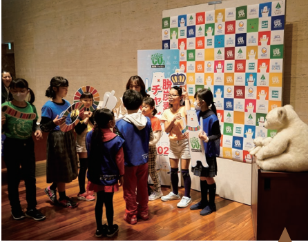
今年も人気のフォトコーナー登場

受付ホワイエおよび、多目的スペースでは、共催・協賛企業/団体のご紹介コーナーやSDGsについてなど、様々な展示コーナーを設けました。また、ファイナリストの活動紹介ポスターを掲示し、プレゼンテーション発表で気になった団体に話を聞くなど、情報交換が行われました。