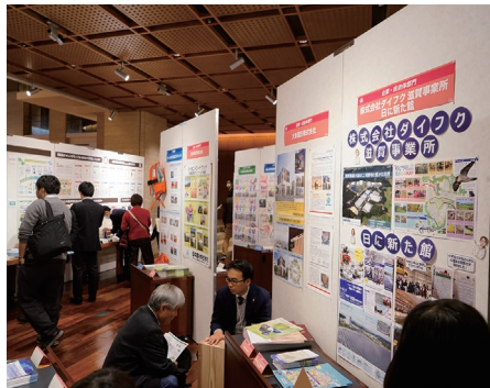
ポスターセッションの様子