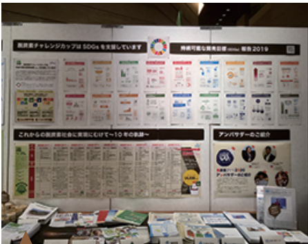
【注目!】国連広報センターから後援を頂き SDGsの紹介コーナーを設置 / 10年間の軌跡の年表を掲示!