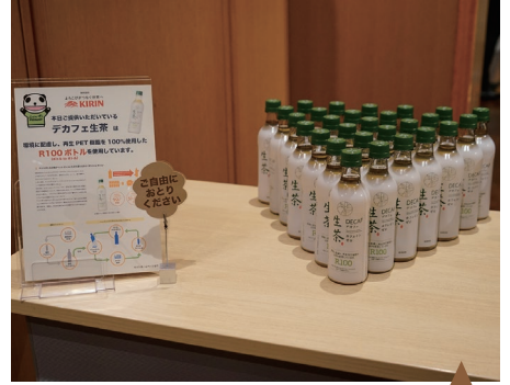
再生PET100%を使用したドリンクを提供 提供:キリンホールディングス様より