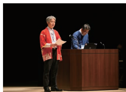
一般社団法人海っ子の森