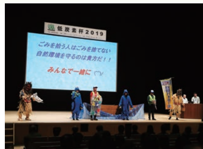
NPO法人秋田パドラーズ