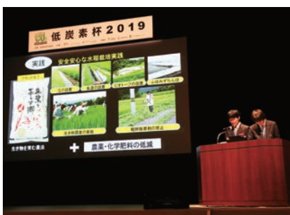
佐渡総合高校GIAHSプロジェクト