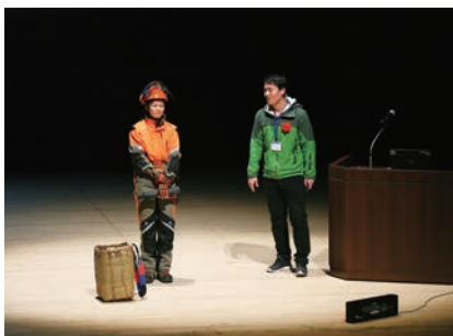
特定非営利活動法人エスピーオー・フュージョン長池