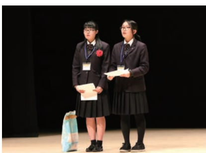
宮城県農業高等学校