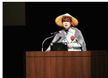
草津電機株式会社