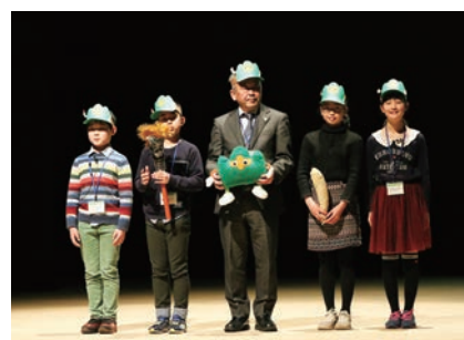
品川区立山中小学校おやこエコクラブ