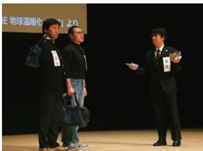
沼津工業高等専門学校と静岡県立工業高等学校の共同研究会