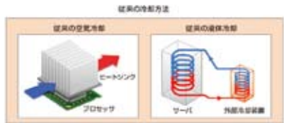
Liquid Loop Cooling