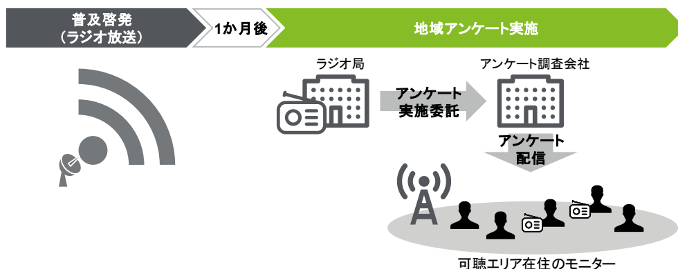
図 1 情報発信型(受動型)事業/ラジオにおけるアンケート実施概要

情報発信型(受動型)事業のラジオでは、アンケート調査会社に委託し、ラジオ放送 1 か月後に放送エリア(可聴エリア)在住のリスナーに対してアンケート(地域アンケート)を行う(図 1)。